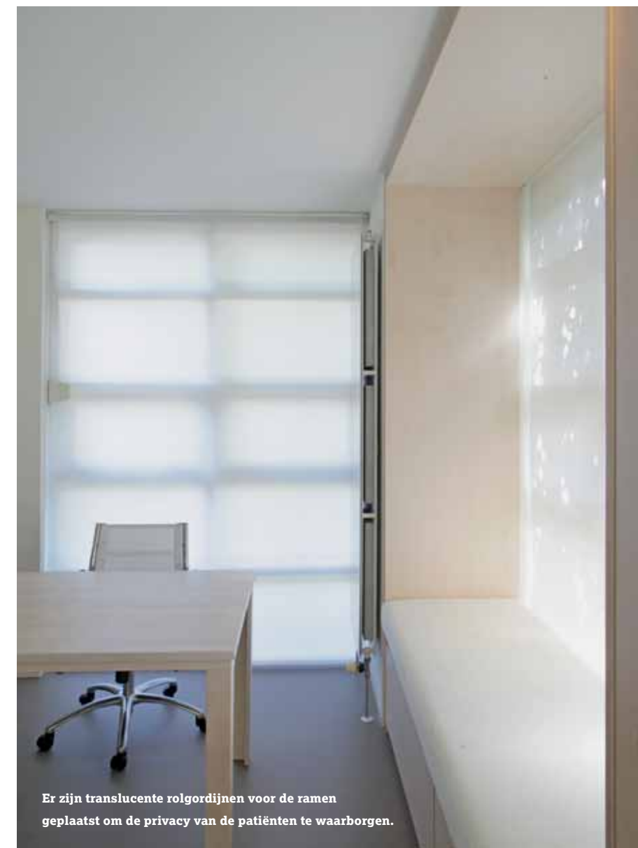
Er zijn translucente rolgordijnen voor de ramen geplaatst om de privacy van de patiënten te waarborgen.

Een geslaagde metamorfose en tevreden gebruikers. De strakke ontwerpstyl van Serge Schoemaker Architects blijkt uitstekend geschikt voor medische ruimtes.